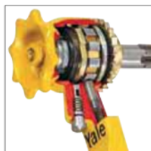
Opcional: Mecanismo de protección contra sobrecargas para D 95 y C/D 85.

¡Desde 1936 se han fabricado en Velbert más de 1 millón de unidades!