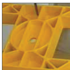
Chasis de hierro dúctil