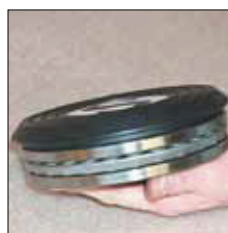
Rodamiento de bolas para la placa giratoria