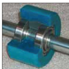
Rodillos con rodamientos de bolas