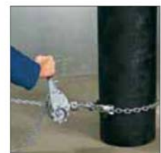
Diseño con eslinga de cadena